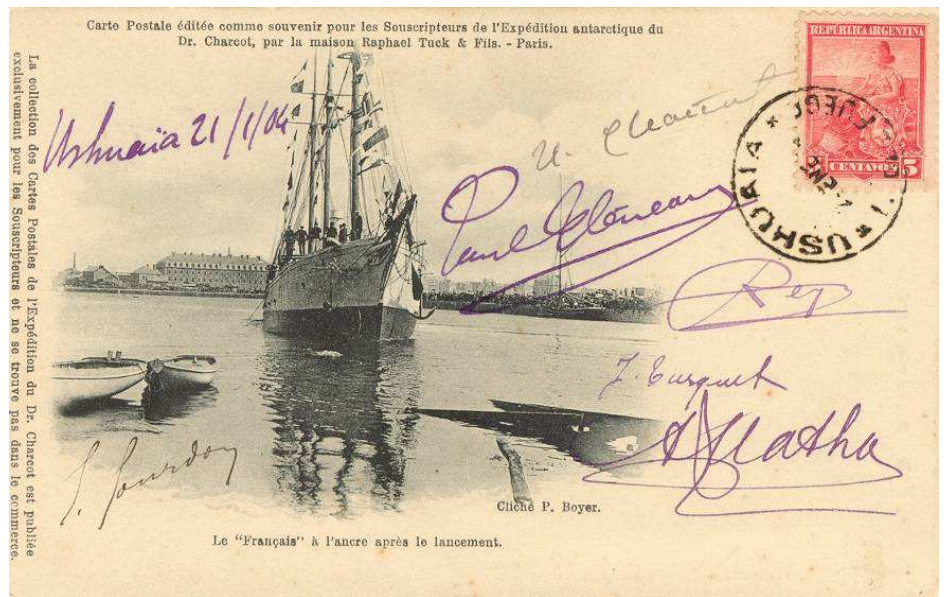
Figure. 4 – Carte postale avec la signature des six membres de l'état-major et ne pouvant alors être assimilée à un imprimé. Affranchissement à 5 centavos (destination Buenos Aires).

Lorsque les conditions de l'imprimé ne peuvent être remplies, c'est le tarif de la carte postale qui s'applique (fig. 4).