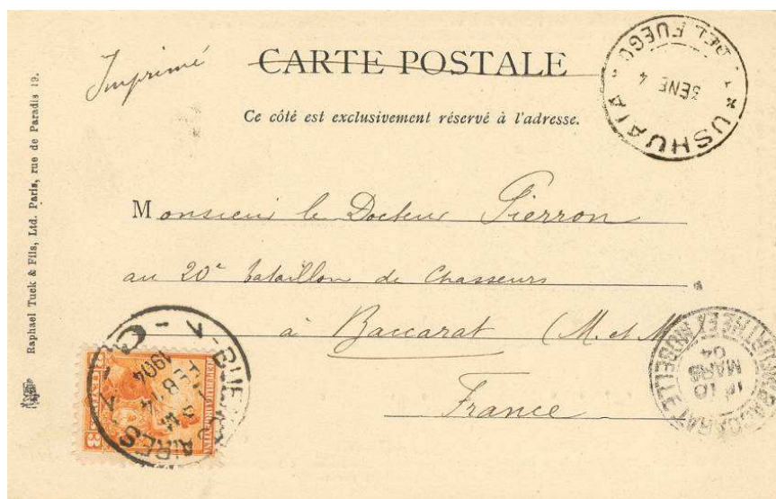
Figure 2 – Mention Imprimé manuscrite. Timbre à date d'Ushuaia du 13 janvier 1904, affranchissement et oblitération à Buenos Aires du 14 février 1904 et cachet d'arrivée à Baccarat.

Chaque carte de la souscription ayant voyagé à bord du Français jusqu'à Ushuaia reçoit un mot manuscrit et la signature de Charcot, en remerciement au souscripteur, avant de lui être renvoyée par voie postale.