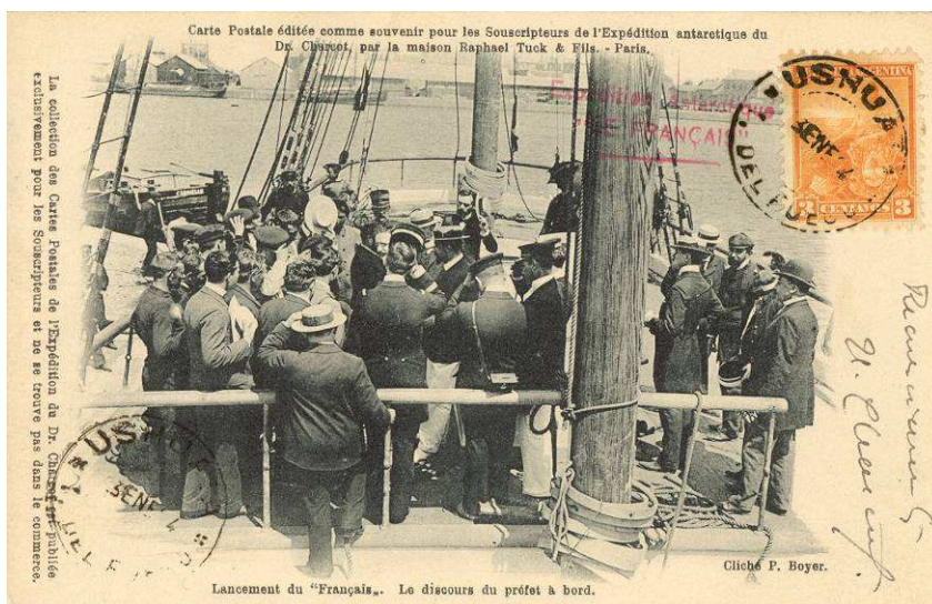
Figure 1 – Affranchissement à 3 centavos et griffe rouge de l'expédition.

Cela est valable pour l'oblitération du 13 janvier. En effet, toutes les cartes de la souscription sont oblitérées à la date du 13 janvier 1904. Même si le chiffre 1 du quantième n'est pas toujours très lisible, il s'agit bien du 13 et non du 3 comme on peut le lire quelquefois (fig. 1).