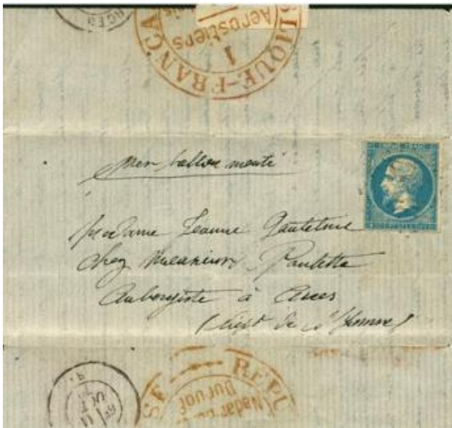
Oblitération GC de Tours