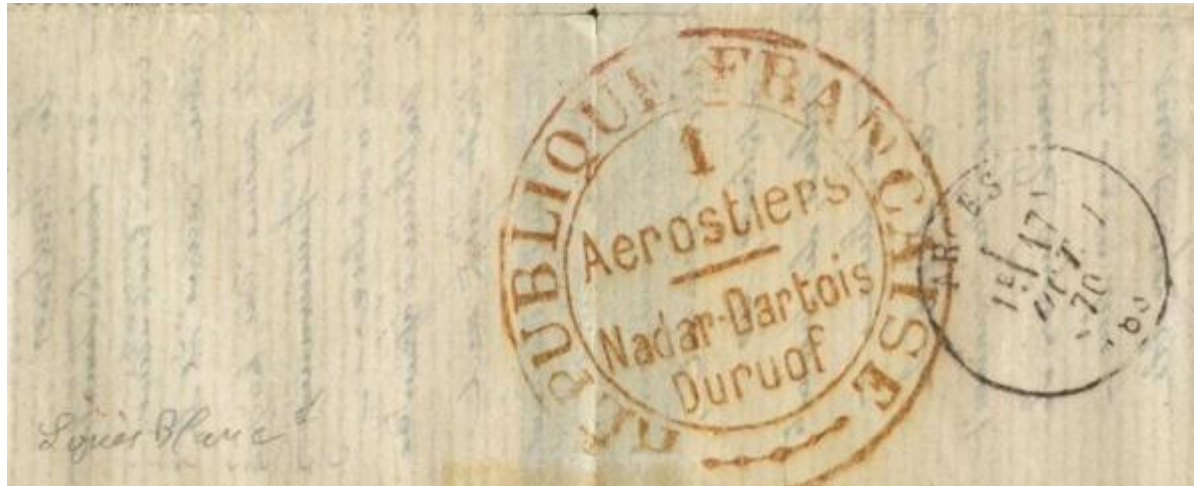
Le ballon verso

L'ouvrage de J. Le Pileur « Les Aérostats Poste 1870-1871 » édition de 1953, indique page 28 pour « Le Washington » : « Néanmoins, sans crainte de se tromper, on peut admettre qu'une lettre remise à la Compagnie des Aérostats, dont elle porte le cachet rouge, dont l'affranchissement a reçu la griffe LIL-P dans un losange de points et qui est revêtue du cachet d'ambulant Lille à Paris du 12 octobre, a bien été transporté par le Washington. »