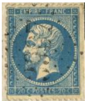
Oblitération du pli à l'expertise