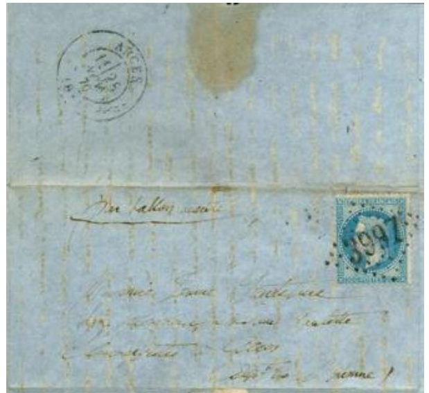
Oblitération GC de Tours