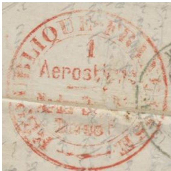
Cachet de référence

Continuons par l'oblitération GC 3997 de Tours. Si elle présente, au premier regard, une similitude aux deux autres oblitérations prises comme références, une observation plus attentive montre des différences constitutives ; l'oblitération du 20 c sur le pli est fautive.