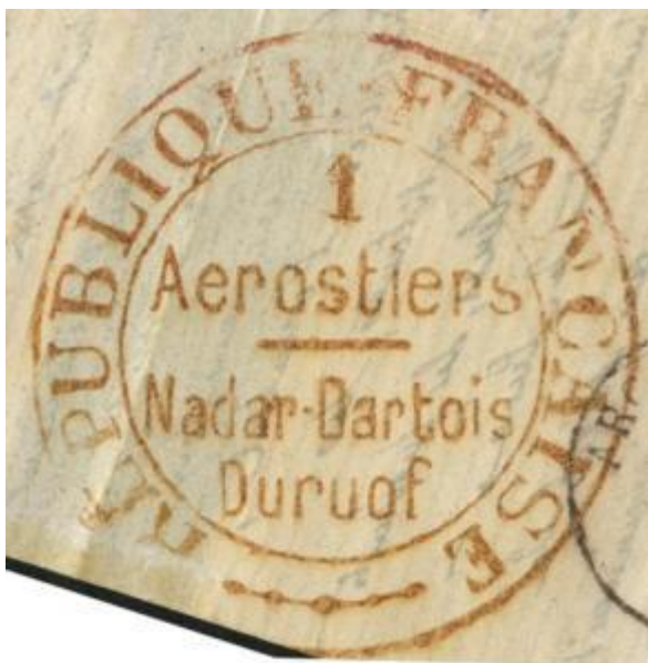
Cachet du pli à l'expertise

Le plus important, ce qui donne de la valeur, c'est le cachet de la Compagnie des Aéroliers apposé en rouge au verso. La comparaison avec un autre cachet de la même compagnie provenant d'un pli authentique montre des différences dans la forme des lettres, dans la netteté des contours. Le motif dans le bas entre les deux cercles est informe. La couleur est rouge brunâtre alors que celle du cachet de droite est rouge vif comme pour tous les cachets authentiques.