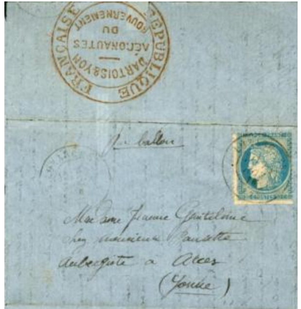
Oblitération cachet à date de Luzarches

Ces quatre plis sont tous à destination d'Arces, pour le même destinataire. Tous les éléments de ces quatre plis sont faux, textes, oblitérations, cachets de la Compagnie des Aéroliers, etc.