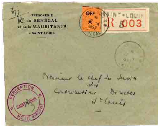
Lettre administrative locale recommandée en franchise de la trésorerie de la Mauritanie installée à Saint-Louis du Sénégal avec ticket de recommandation « OFF » oblitéré SAINT-LOUIS 27/4/1957.