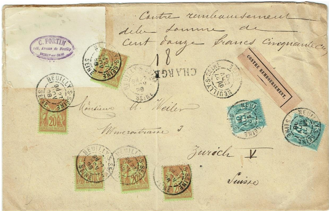
Envoi contre remboursement de 112,50 francs pour la Suisse le 27 novembre 1898 Droit de recommandation de 25 c. Imprimé pour 85 c (5 c par 50 g)