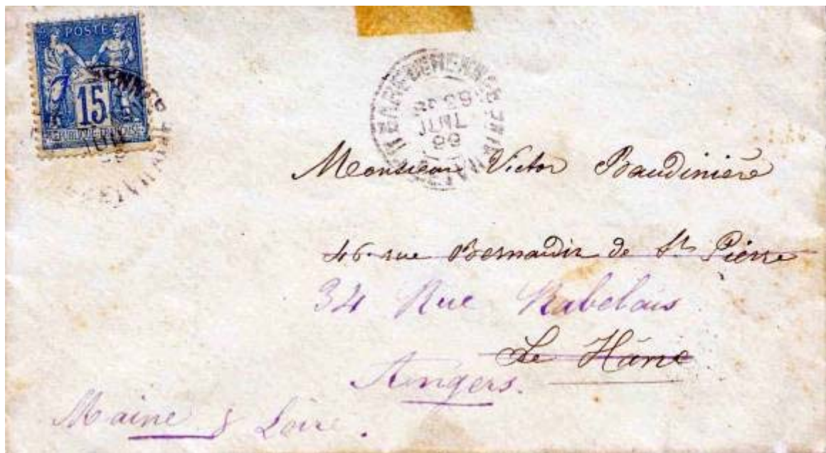
L'enveloppe d'envoi du message