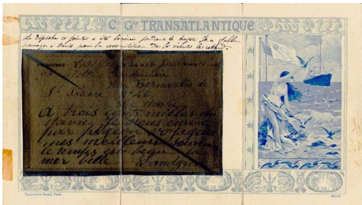
Le message fixé sur le formulaire, et le verso de celui-ci.

Quoi qu'il en soit les essais se poursuivirent et, à partir de mai 1899, les voyageurs purent utiliser le service des pigeongrammes. Après le départ du Havre, on distribuait aux voyageurs une carte spéciale sur laquelle ils pouvaient rédiger leur message. La carte était ensuite réduite par photographie sur une pellicule très mince qui était enfermée dans un tube, lui-même fixé à la patte du pigeon. À l'arrivée, le cliché était agrandi et collé sur un dépliant spécial, et l'ensemble était expédié par poste au destinataire, au départ de Rennes où se trouvait la société colombophile "l'Abeille" qui fournissait les pigeons et les récupérait. Les aléas de ce mode de transport firent que l'expérience fut très rapidement abandonnée ; ce qui fait que l'on n'a recensé à ce jour que deux pièces qui ont participé à ce service.