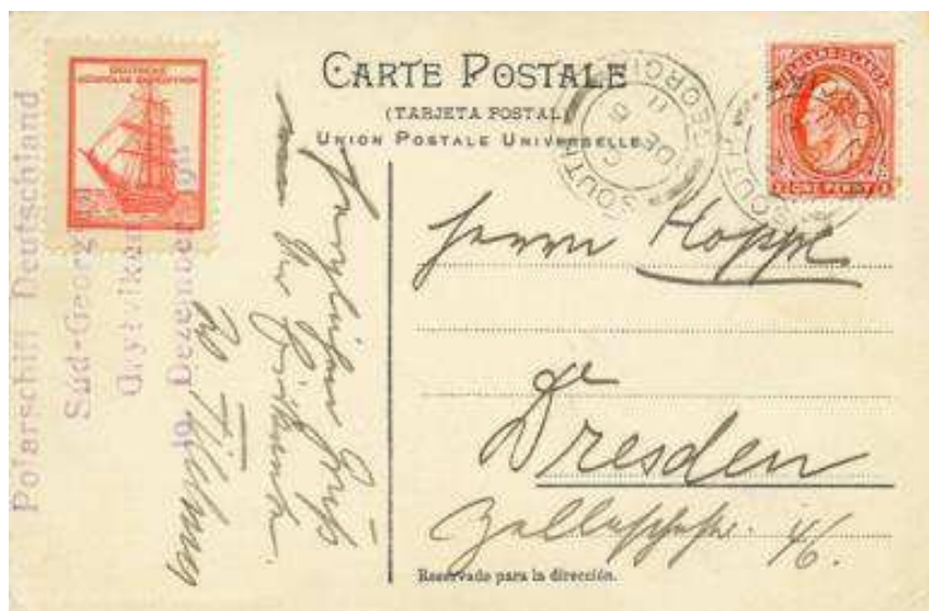
Carte postale autographe signée Wilhelm Filchner, chef d'expédition, avec timbre à date du 6 décembre 1911.

Une nouvelle période d'utilisation de cette griffe provisoire va commencer. Lors du remontage de cette dernière, un "A" va être inséré à la place du "a" pour le mot "at/AT". La griffe "Paid At / SOUTH GEORGIA" va être utilisée du 16 décembre 1911 au 26 février 1912.