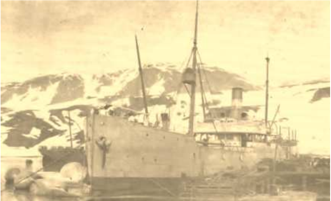
Le Harpon de la PESCA à quai à Grytviken. Le 15 février 1912, il emporte 6140 barils d'huile de baleine, cinq tonnes de guano et le courrier (neuf pièces répertoriées dans les archives).

L'approvisionnement des timbres-poste et le départ du courrier était effectué par les navires de la compagnie argentine PESCA.