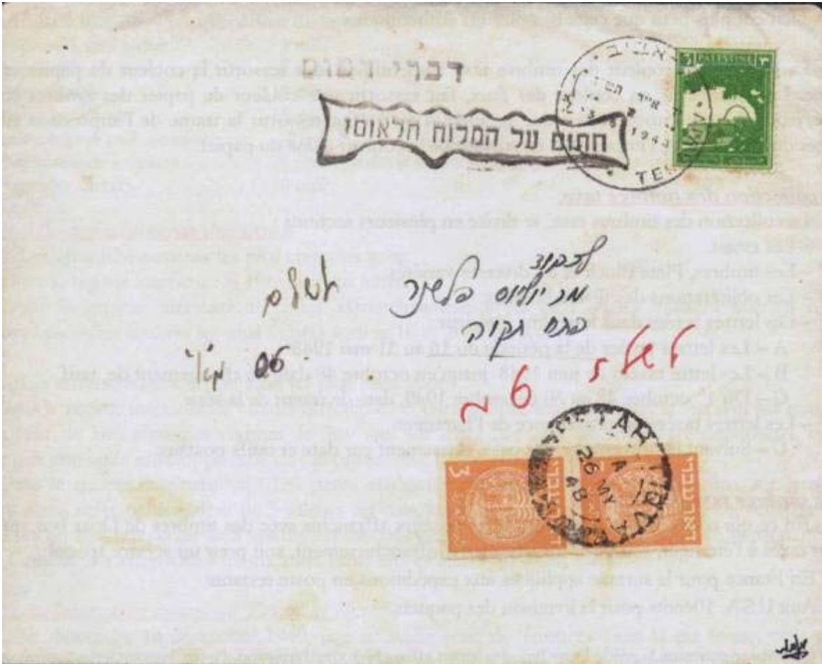
Imprimé sous enveloppe affranchi à 3mils par un timbre démonétisé, oblitéré de Tel-Aviv le 23 mai 1948. Taxe à 6 mils par une paire de timbres-poste " Doar Ivri " utilisés comme timbres-taxe oblitérés par le timbre à date de Petach Tikva à croix de Malte du mandat britannique du 26 mai 1948.