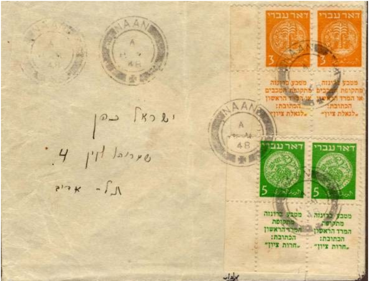
Lettre oblitérée par le timbre à date du mandat britannique Naan 16 MY 48 affranchie à 16 millièmes : 3m (10x10) x 2 + 5m x 2 au deuxième échelon de poids (deux lettres connues)..