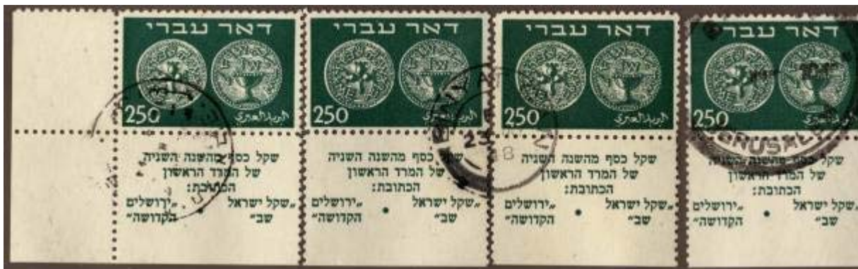
250 m, reconstitution par planchage du 'Tabs Rows' par cinq exemplaires oblitérées (1- tad trilingue TelAviv ; 2 tad du mandat double cercle de Binyamina ; 3 tad local Jerusalem 'Libération' ; 5 – tad trilingue de Haifa).