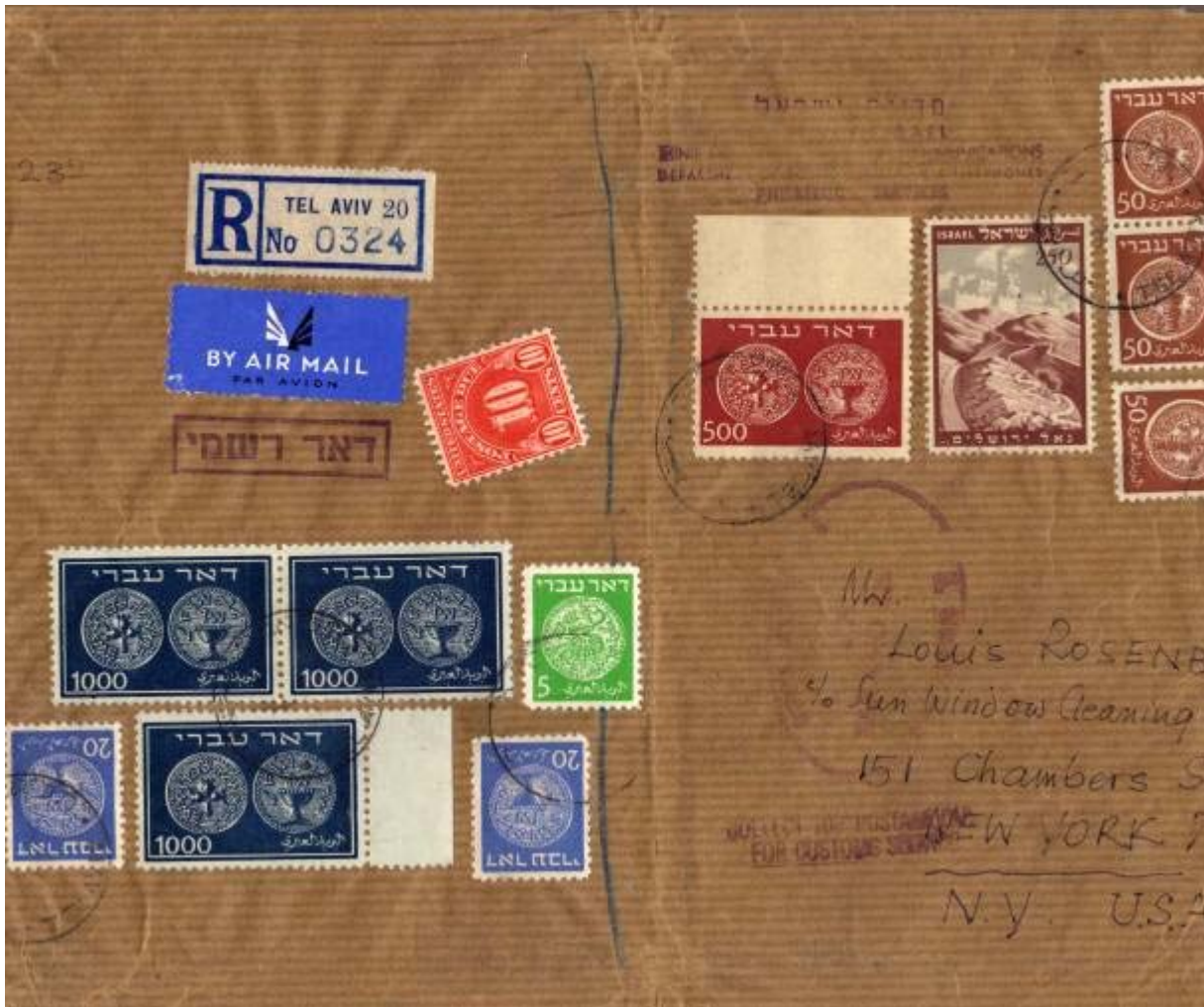
Lettre de Tel Aviv à destination des USA, affranchissement à 3945 mils. Soit un 49 ème échelon de port (80 m x 49) + 25 m de recommandation..