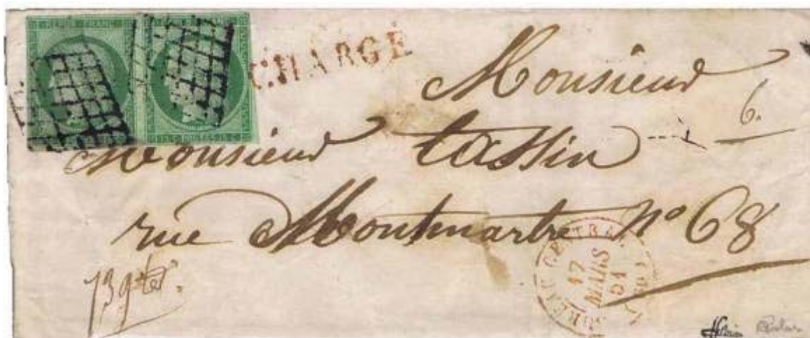
Chargé local de Paris pour Paris de mars 1851 avec indication de poids de 13 g.

La lettre de Paris pour Paris du premier échelon de poids de moins de 15 g est à 15 centimes.