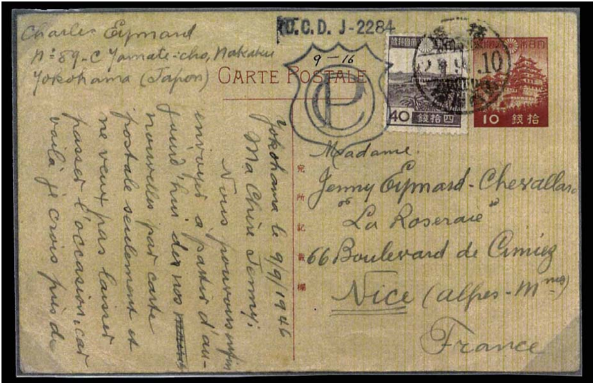
Carte du 1er jour de réouverture du service postal au public.

Après une interruption de plus de cinq ans, la poste internationale est rouverte le 10 septembre 1946. Mais le service se limite aux cartes postales expédiées par les particuliers, et l'échange postal entre le Japon et l'Allemagne est interdit. Tous les courriers internationaux sont censurés par les Armées d'Occupation. Cette carte a été acheminée par le "Frank P. Kellogg", paquebot américain parti de Yokohama.