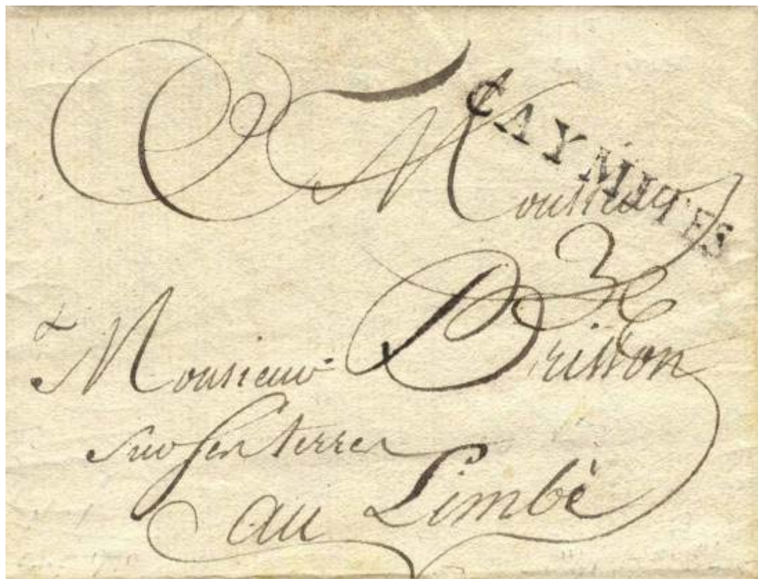
21 août 1790, lettre de Plymouth, quartier de Caymites, département du Sud, à destination du Limbé, taxation à 3 escalins. Ce bureau a été ouvert en 1790 et fermé dès les premiers troubles la même année.

Cette présentation retrace la période qui verra Saint-Domingue devenir Haïti. Elle mêle étroitement histoire postale et Histoire avec un grand H. Cette indépendance fut payée au prix fort. L'année 1790 voit apparaître les premiers troubles à la suite de l'élection de l'Assemblée coloniale, composée uniquement de blancs refusant tout droit aux libres de couleur. Cette même année marque le début de la destruction quasi totale du service postal.