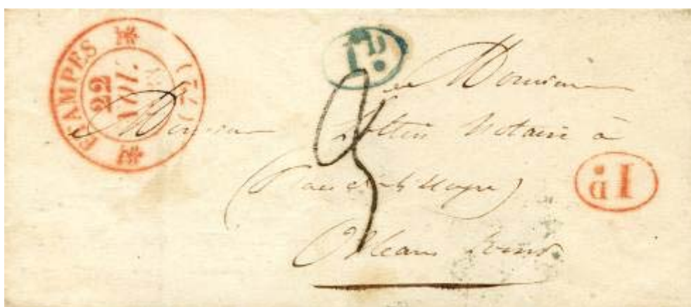
Décime rural frappé deux fois dont une fois en bleu, double erreur du postier