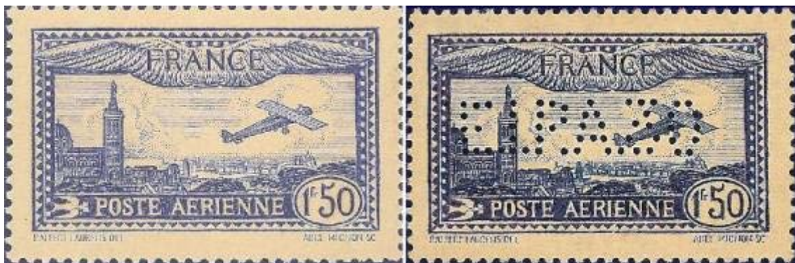
1 f 50 outremer et 1 F 50 bleu avec fausse perforation La perforation n'a été faite que sur le timbre outremer