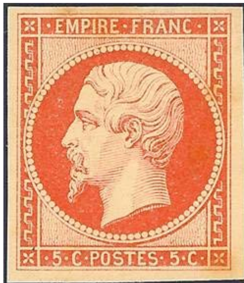
Un des essais de couleur pour le 80 c

• de la lumière environnante , qu'il s'agisse de celle du soleil à différents moments de la journée ou de celle provenant des nombreux types d'éclairage artificiel, expliquée à l'aide de schémas et de graphiques,