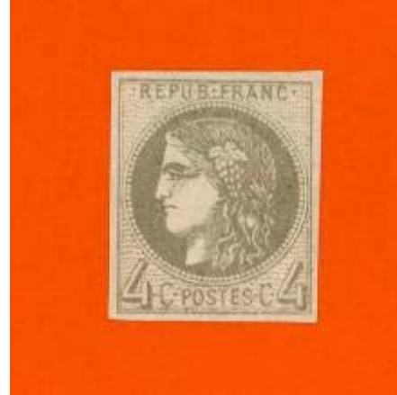
Le même 4 c gris sur fonds de couleurs différentes (beige, jaune, noir et orange) donnant l'illusion de timbres de tonalités différentes