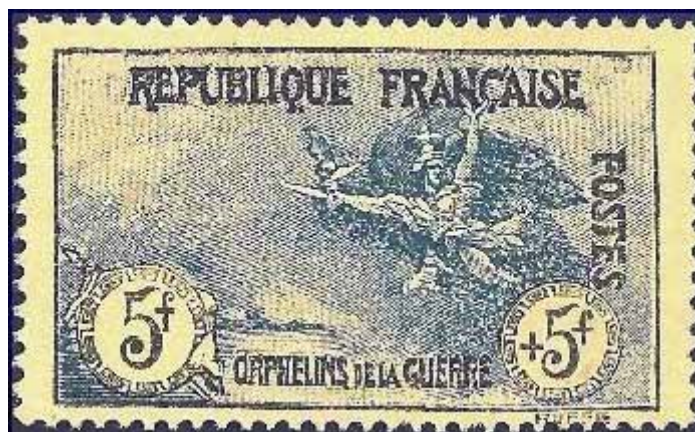
5F +5 F faux fabriqué à partir d'un 5 F + 1 F. Mais le bleu du 5 F+ 5 F est différent de celui du 5 F+ 1 F