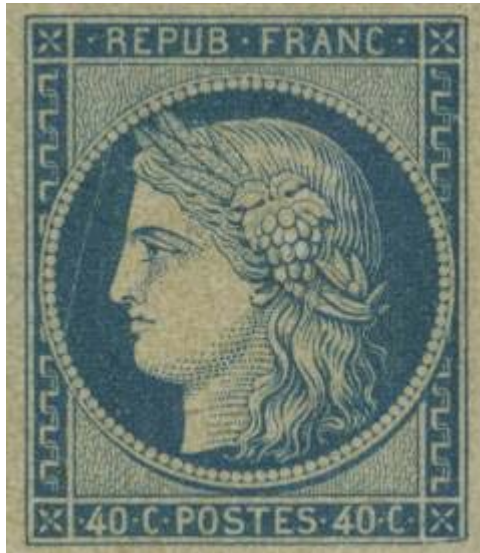
40 c Cérés en bleu, non émis en 1849