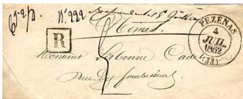
R de la recommandation, en noir, réglementairement sur les lettres en port dû