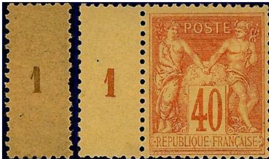
40 c avec millésime 1 et faux millésime 1 détaché La couleur du papier ne correspond pas à l'original