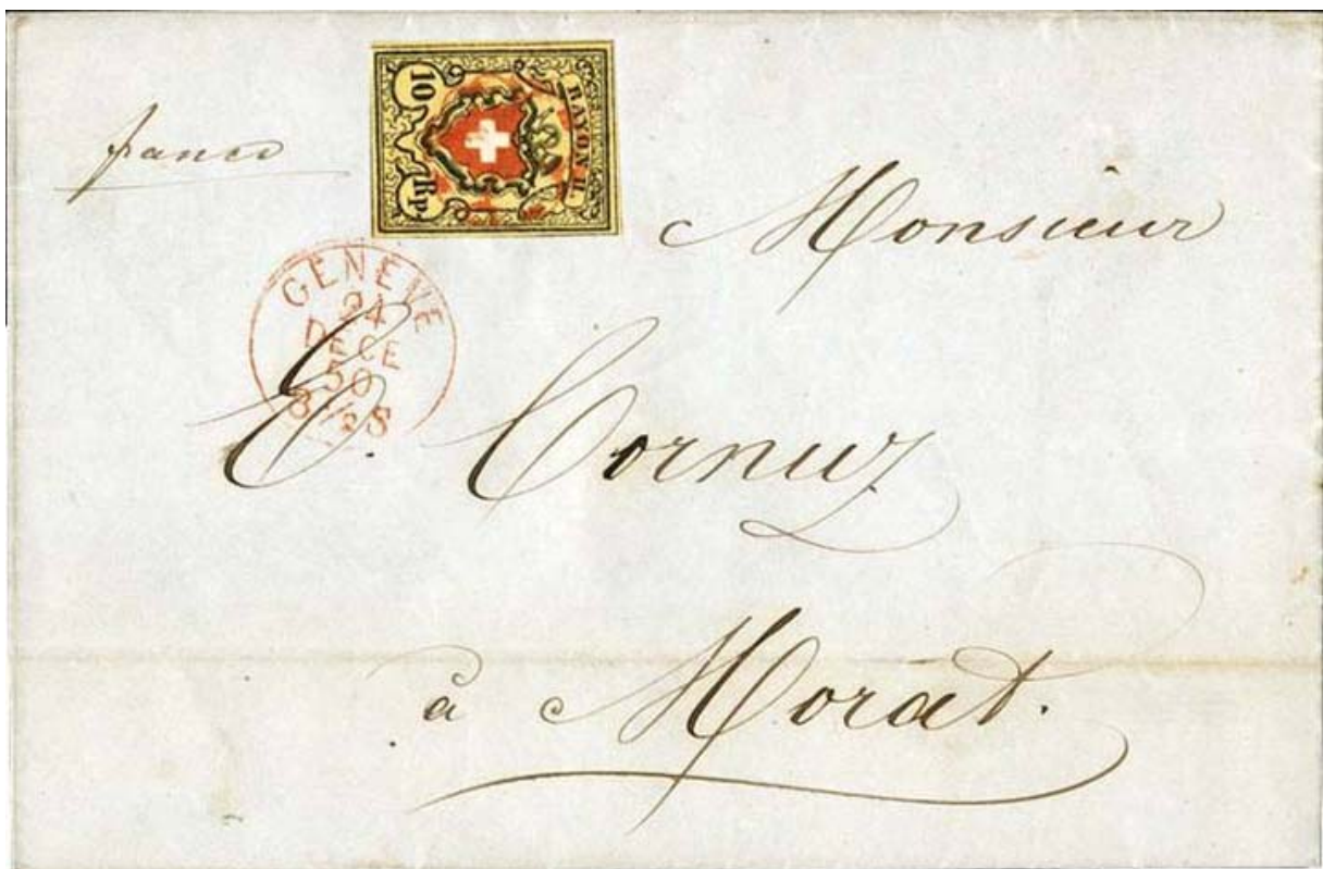
24 décembre 1850 – Lettre de Genève pour Morat (2 e rayon de distance), affranchie avec le nouveau timbre fédéral à 10 rappes, vendu 15 c de Genève. L'utilisation de deux timbres à 5 rappes est insuffisante, car ils sont vendus 5 c de Genève !