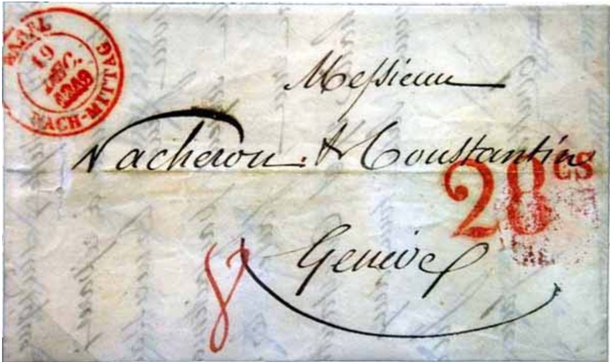
19 décembre 1849 – Lettre de Bâle pour Genève taxée 8 kreuzers, soit 28 c de Genève (4 e rayon de distance). La conversion au centime le plus proche, jugée peu lisible, est abandonnée après moins de 4 mois, pour faire place à un régime aux 5 centimes supérieurs ou inférieurs, bien plus arbitraire.