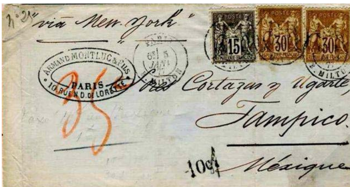
Lettre du 5 janvier 1877 affranchie à 75 c par la voie des États-Unis pour le Mexique qui ne rentrera dans l'UPU que le 1 er avril 1879. Le tarif comprend 40 c de tarif UGP pour les États-Unis et 35 c

À travers de nombreux exemples qu'il a référencés, y compris dans d'autres collections que la sienne et dans les ventes, le conférencier décrit avec précision la transition progressive entre période classique et période semi-moderne que connaît ce timbre. Les tarifs avec surtaxe maritime, des destinations hors Union générale des postes (puis UPU), des cas d'affranchissements « après coup », des insuffisances d'affranchissement relevées ou non et des lettres revêtues de taxes et de marques d'échange sont exposés pour la période avant le 1 er octobre 1881, date à laquelle l'essentiel des évolutions de tarifs a eu lieu. La recommandation, les valeurs déclarées, les levées exceptionnelles et les bien rares avis de réception sont passés en revue. Le conférencier n'oublie pas les objets expédiés depuis les agences postales françaises d'Amérique et les bureaux français à l'étranger (Levant, Yokohama et Shanghai). Il en profite pour éclaircir la réglementation des affranchissements mixtes franco-chinois. Enfin, avec la création de nouveaux services (carte postale avec réponse payée, exprès, contre remboursement, pneumatiques) ou avec le cas du régime franco-colonial ainsi que des tarifs militaires, il démontre que le sujet est bien plus ardu mais aussi plus intéressant que ce que l'on pouvait penser.