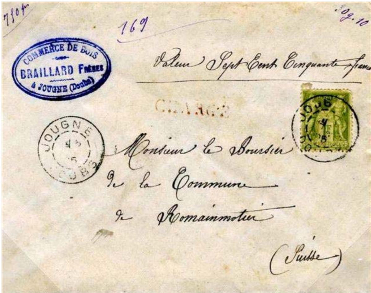
Lettre de 1895 frontalière pour la Suisse, pesant 30,10 g, avec valeur déclarée de 750 F. Le tarif se décompose en 45 c pour le 3 e échelon du rayon limitrophe, 25 c de recommandation et 30 c d'assurance, à raison de 10 c par 300 F.