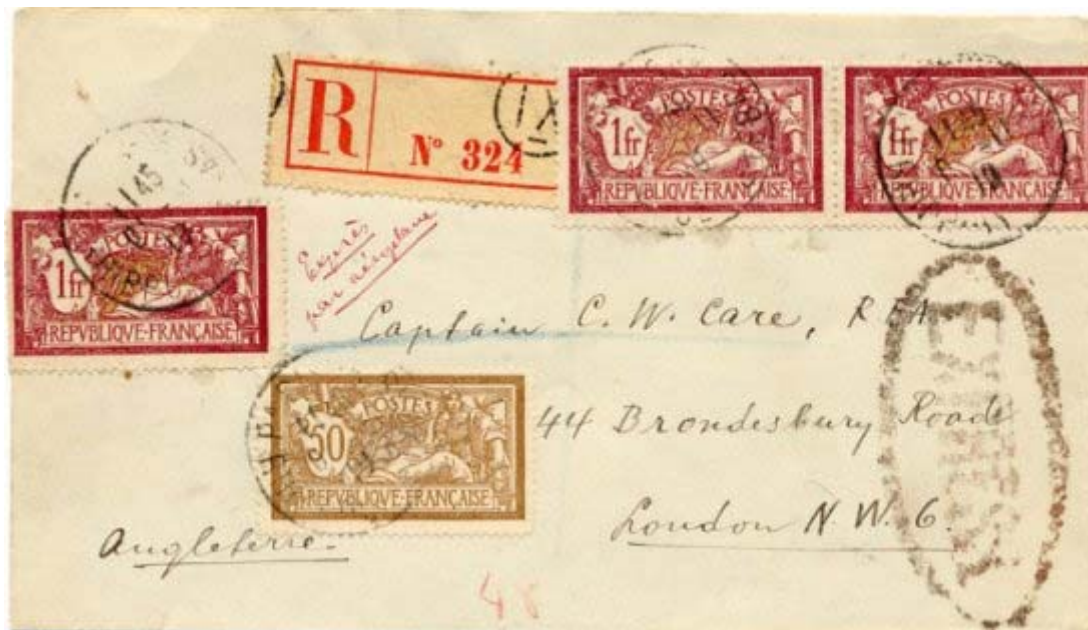
11 novembre 1919, 1 er jour de fonctionnement de la ligne aérienne Paris Londres. Affranchissement à 3,50 F (lettre UPU 0,25 + surtaxe aérienne Paris-Londres comprenant la surtaxe d'express 3,00 + taxe de recommandation du 16.1.1879 (0,25))