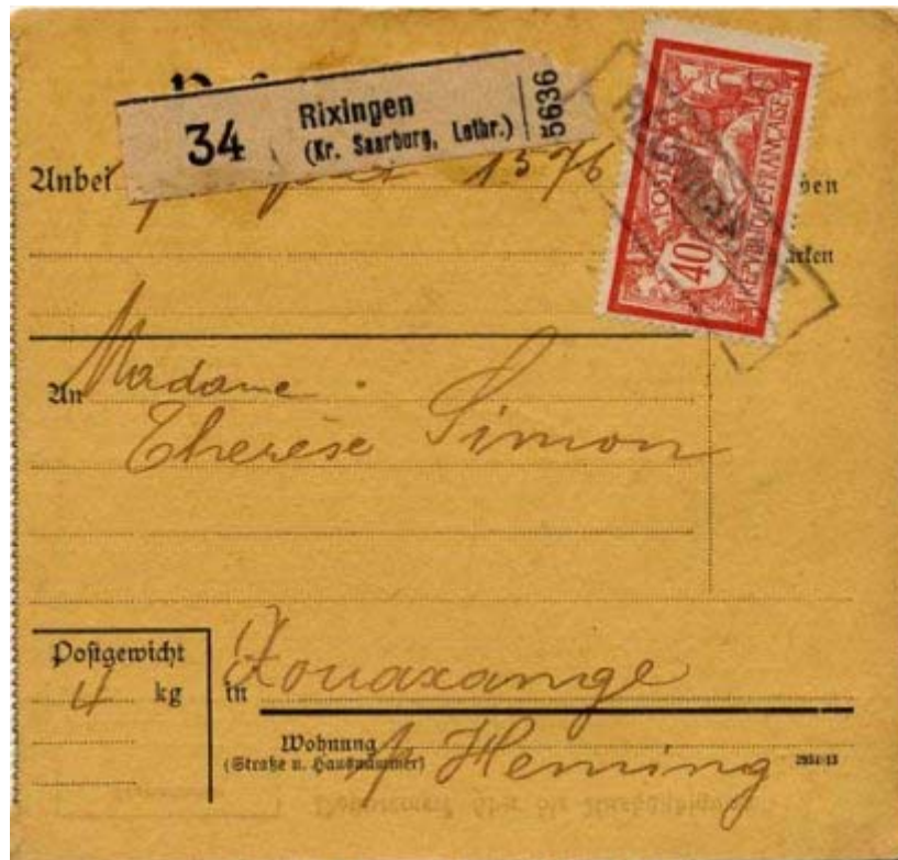
Griffe provisoire de Rechicourt oblitérant un 40 c sur un bulletin de colis postal du service intérieur d'Alsace-Lorraine d'avril 1919 au tarif du 15 décembre 1918 pour moins de 5 kg à moins de 75 km