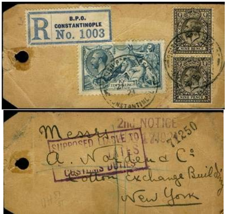
Étiquette d'un objet recommandé affranchie avec une paire de 9 pence et un exemplaire du 10 shillings 'Seahorses' pour New-York