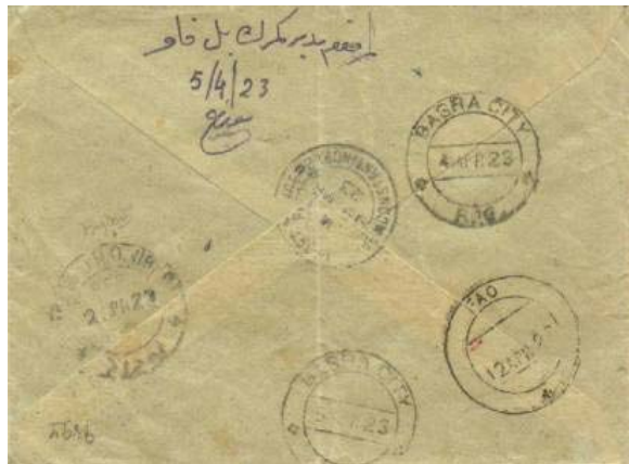
Lettre recommandée par avion de Constantinople à destination de Bassorah puis réexpédiée à Fao (7 ½ piastres de port, plus 7 ½ piastres de recommandation, plus 6 pence de surtaxe aérienne)