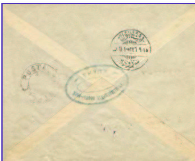
Lettre d'Adana pour Constantinople du 5 août 1920 affranchie avec une paire du timbre fiscal turc de 5 parassurchargé OMF Cilicie 3 ½ piastres (3 ½ piastres + 3 ½ piastres de recommandation).