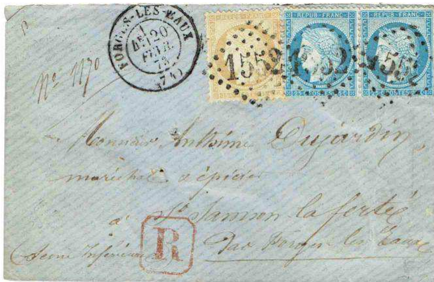
Figure 4. Lettre recommandée de Forges-les-Eaux pour Saint Samson-la-Ferté le 20 février 1873 (une des premières dates rencontrées), affranchie à 65 centimes : 50 c de droit de recommandation et 15 c pour une lettre de proximité jusqu'à 10 g.

À partir de février 1873 (vers le 15 février) la recommandation est étendue au régime intérieur français (fig. 4) avec un taux fixe de 50 centimes pour les lettres et un taux réduit de 25 centimes pour les autres objets. Les différents tarifs sont illustrés jusqu'au 15 janvier 1879. Le 16 janvier 1879, le taux de recommandation est fixé à 25 centimes pour tous les objets.