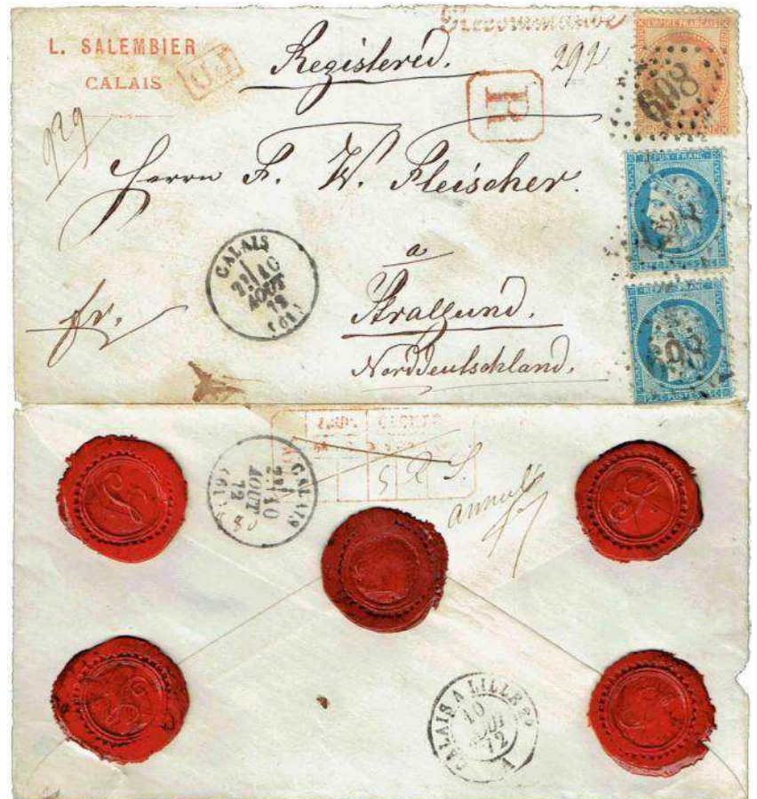
Figure 3. Lettre recommandée de Calais pour Stralsund (Allemagne) le 10 août 1872, affranchie à 90 centimes : 50 c de droit de recommandation et 40 c pour une lettre jusqu'à 10 g.