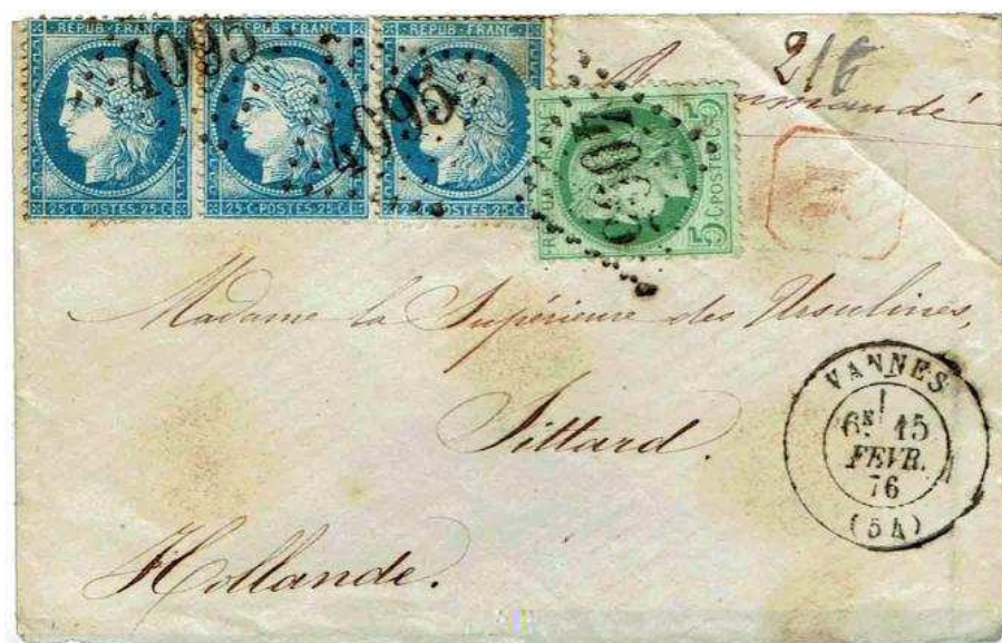
Figure 5. Lettre recommandée de Vannes pour Sittard (Pays-Bas) le 15 février 1876, affranchie à 80 centimes : 50 c de droit de recommandation et 30 c pour une lettre jusqu'à 15 g (tarif UGP du 1er janvier 1876).

La fin de la conférence est consacrée aux relations internationales avec la présentation de pièces de la convention franco-allemande jusqu'au 31 décembre 1875. À partir du 1er janvier 1876, des pièces de la convention de l'Union générale des Postes sont également présentées pour Allemagne, Belgique, Italie, Suisse, Grande-Bretagne et Pays-Bas (fig. 5).