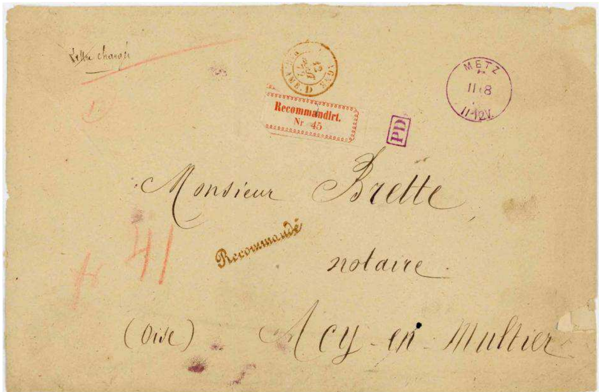
Figure 1. Lettre recommandée de Metz (Lorraine annexée) pour Acis-en-Multier le 11 août 1872, affranchie en numéraire à 41 groschens : 2 gr de droit de recommandation et 39 gr pour une lettre de 120 à 130 g (3 gr par 10 g).

L'instruction n°55 du BM des Postes du 23 mai 1872 correspond à l'exécution de la convention de poste conclue entre la France et l'Allemagne le 12 février 1872. Cette instruction va réintroduire la recommandation. Le paragraphe 4 différencie les lettres portant déclaration de valeurs et celles qui sont recommandées. Le paragraphe 5 indique qu'un nouveau timbre « Recommandé » linéaire sera frappé par le bureau d'échange sur les deux types d'envois (fig. 1).