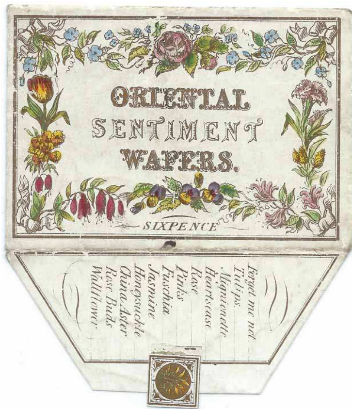
Figure 4. Enveloppe « ORIENTAL SENTIMENT WAFERS ». Assortiment d'une cinquantaine de wafers à motifs variables pour 6 pence : Forget me not, Your qualities surpass your charms, Love, Pure love, Fidelity, Devoted, etc. (7,8 x 5,5 mm).