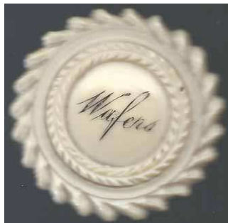
Figure 2. Boite en ivoire « Wafers » (4 x 3,3 cm).