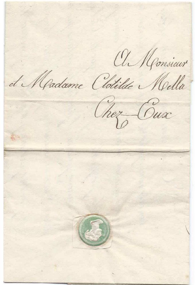
Figures 1A et B. Lettre de vœux par porteur d'une fille à ses parents datée de Turin 1er janvier 1836 adressée à « Mr et Mme Clotilde M... chez Eux » (A). Fermeture par camée de style antique (B).