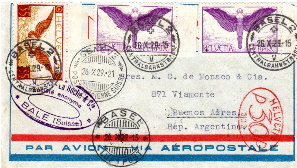
3. Enveloppe expédiée de BASEL le 26.X.39 pour BUENOS AIRES affranchie à 2,65 F (30 c de lettre simple + 2,35 F de surtaxe aérienne par 5 g selon le tarif du 01.08.1928). Cette enveloppe utilise successivement : 1) avion entre Bâle et Genève, 2) train entre Genève et Toulouse, 3) avion CGA Toulouse – Dakar, 4) bateau Dakar – Natal et enfin 5) avion entre Natal et Buenos Aires où elle arrive le 12.11.1929.